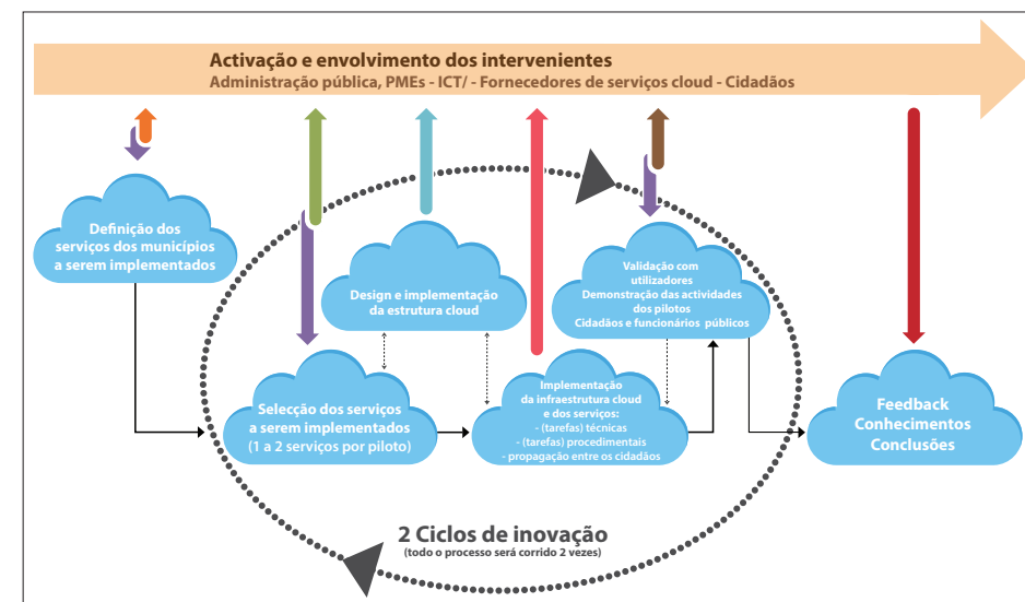
Figura 2. Ciclo de Vida do projecto STORM CLOUDS